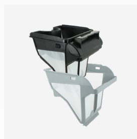
Caixa filtrante Filtro de nível duplo : 150/60 µ