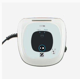
Caixa de comando