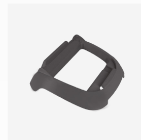
Base para caixa de controle